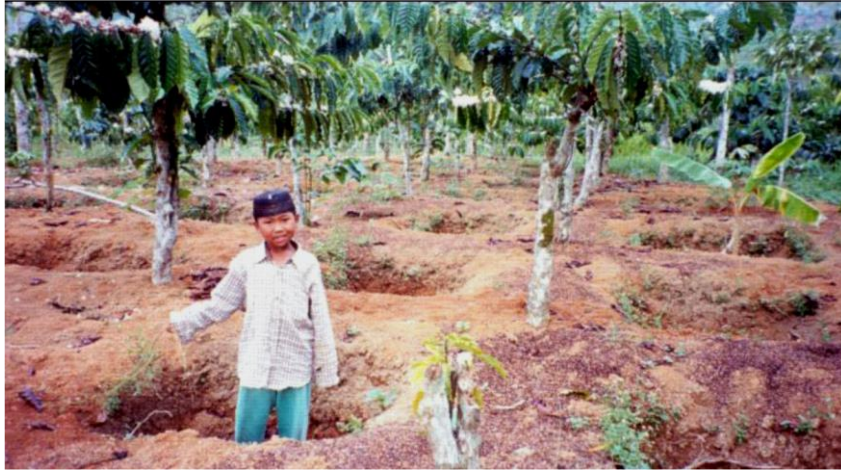
Gambar 2. Rorak pada perkebunan kopi rakyat di Sumberjaya, Lampung

Rorak dapat mendistribusikan air secara merata dalam suatu wilayah/hamparan yang ditandai dengan tidak berbedanya kadar lengas tanah kedalam 0-20 cm di bagian atas, tengah, dan bawah pada kisaran 29-32%. Sementara itu, pada lahan yang tidak dirorak, kadar lengas tanah (0-20 cm) untuk hamparan bagian atas 27%, bagian tengah 28%, dan bagian bawah 32%. Rorak mampu menurunkan aliran permukaan sebesar 42% dan menurunkan erosi sebesar 62%, sehingga dapat menurunkan proses degradasi lahan dan dapat menekan resiko banjir dan kekeringan ( Rejekiingrum dan Haryati, 2002 ).