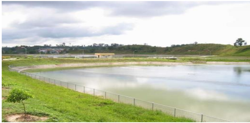
Gambar 4. Waduk atau Embung tempat penampungan air hujan yang berfungsi sebagai sumber air di musim kemarau (sumber: Faesal, Syuryawati dan Zubachtirodin, 2009)

Sumur resapan merupakan salah satu cara konservasi air tanah. Caranya dengan membuat bangunan berupa sumur yang berfungsi untuk memasukkan air hujan kedalam tanah. Manfaat: 1) menambah jumlah air yang masuk ke dalam tanah sehingga dapat menjaga kesetimbangan hidrologi air tanah sehingga dapat mencegah intrusi air laut, 2) Mereduksi dimensi jaringan drainase dapat sampai nol jika diperlukan. 3) Menurunkan konsentrasi pencemaran air tanah, 4) Mempertahankan tinggi muka air tanah. 5) Sumur resapan mempunyai manfaat untuk mengurangi limpasan permukaan sehingga dapat mencegah banjir. 5) Mencegah terjadinya penurunan tanah. 6) Melestarikan teknologi tradisional. 7) Sumur resapan dapat menambah jumlah air yang masuk kedalam tanah dan mengisi pori-pori tanah hal ini akan mencegah terjadinya penurunan tanah. Penerapan sumur resapan dengan diameter 1 m dan kedalaman 2 m, dengan kapasitas 1,57 m 3 dengan laju pengisian selama 70 detik pada ketinggian muka air tanah > 20 m pada 66 unit rumah mampu menekan aliran permukaan sebesar 103,62 m 3 (Arafat, 2012).