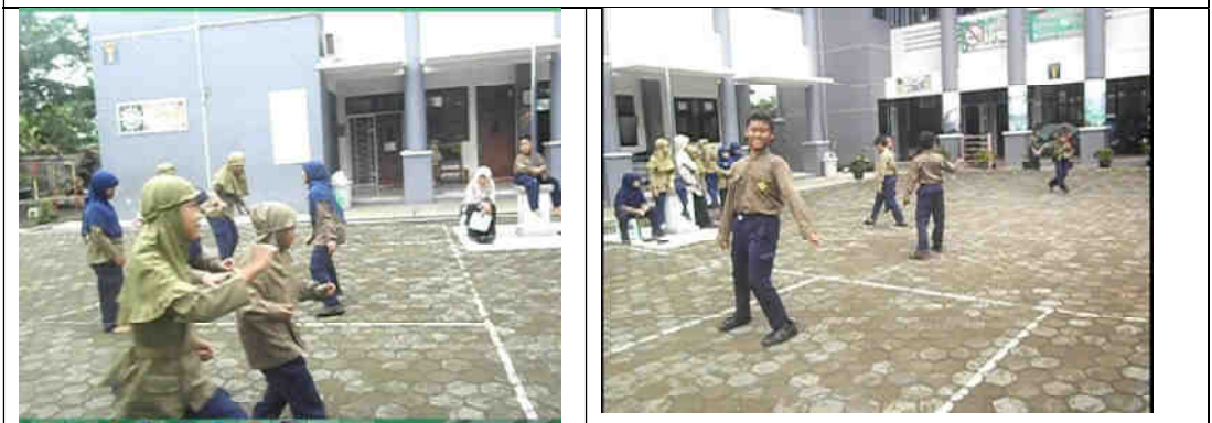
Gambar 3 dan 4 Aktivitas kegiatan yang memunculkan group processing dan face-to-face interaction dalam Gobag Sodor

Gotong Royong biasanya diartikan sebagai kegiatan atau pekerjaan yang dilakukan secara bersama-sama atau ditanggung atau dipikul bersama (Rochmadi, 2012). Dalam tingkat anak-anak akan tampak sewaktu melakukan permainan tradisional yang melibatkan orang banyak (berkelompok). Dalam permainan