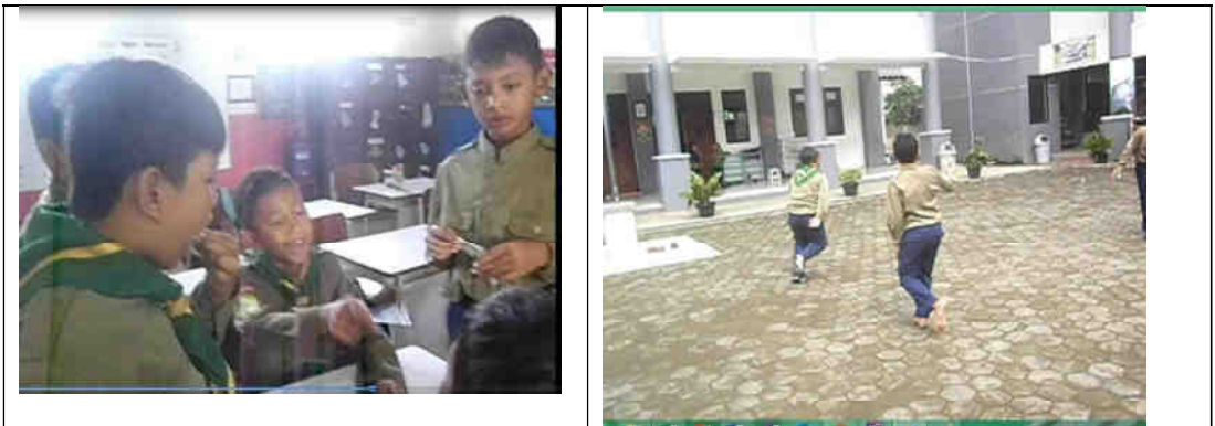
Gambar 1 dan 2 Aktivitas kegiatan yang memunculkan positive interdependence dan independent accountability dalam Gobag Sodor

appropriate use of collaborative skill dan individual accountability terutama pada saat merancang strategi permainan berdasarkan kemampuan yang dimiliki setiap anggota tim. Proses kepemimpinan dalam permainan ini berjalan secara alami tanpa adanya campur tangan dari guru.