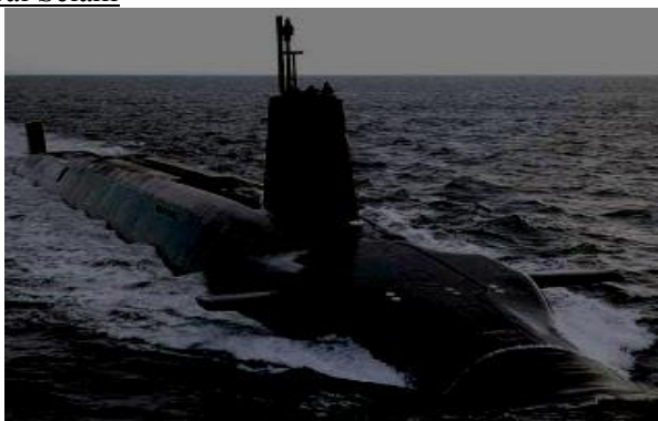
Gambar 2. Kapal selam

Selain digunakan pada termometer dan tes ujian SPMB, bilangan bulat juga digunakan pada kapal selam. Kapal selam digunakan untuk kepentingan penjagaan, perang, dan operasi-operasi penyelamatan.