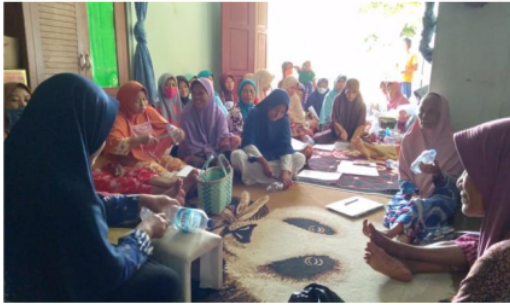
Gambar 1. Praktik pembuatan ovitrap

mendengar istilah ovitrap. Peserta secara aktif melakukan pembuatan ovitrap dengan botol air mineral (Gambar 1).